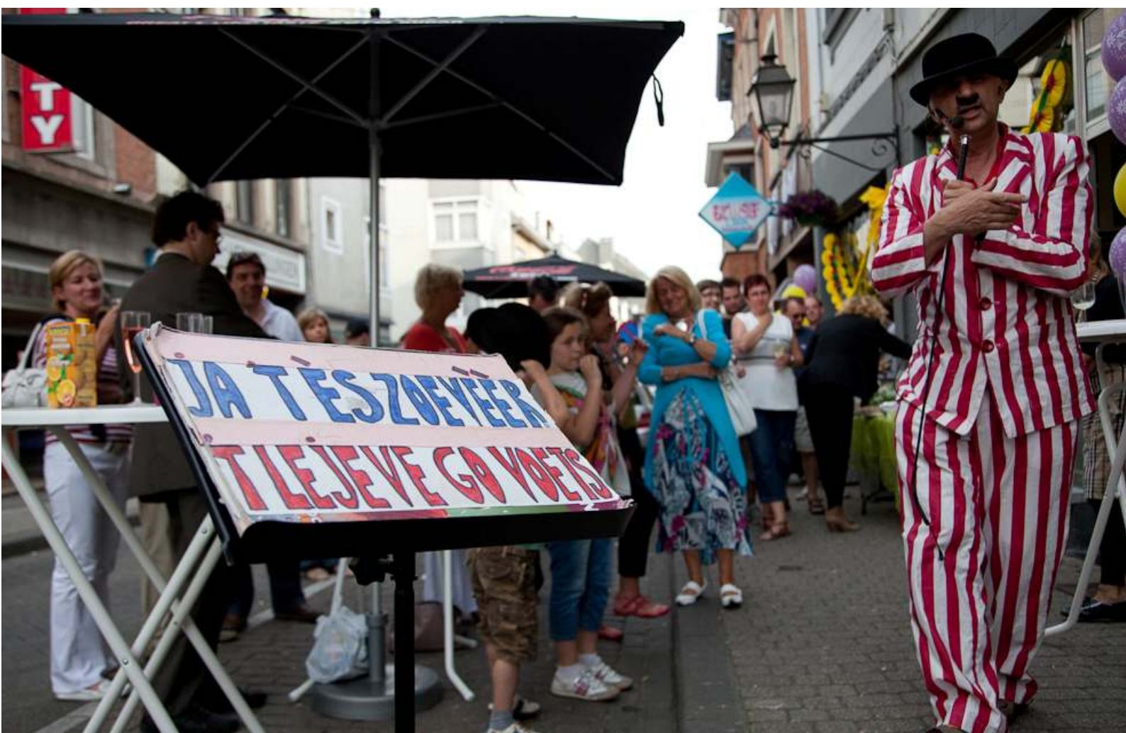
Dag van de Buren Gilainstraat 2010

KWB Vlaams-Brabant - kwb.brabant@kwb.be - 02 557 88 00 - www.buurtbox.be