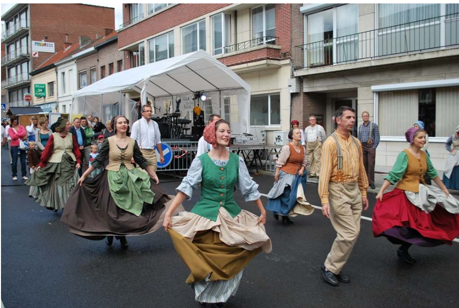
Braderie Gilainstraat 2010

Het verleden is wat ons bindt. Ga op zoek naar het verhaal van je buurt. Doorzoek het stadsarchief, raadpleeg de Tiense Gidsenbond of enkele (oudere) buurtbewoners en zoek naar foto's en extra informatie. Kortom, verzamel het nog aanwezige erfgoed. Stel dit op een vertelavond aan de buurt voor. Op deze avond kunnen senioren getuigen en kan er bijvoorbeeld een toneel opgevoerd worden over vroegere gebeurtenissen in de buurt.